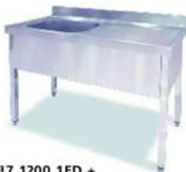
FI7 1200 1ED + BAST 127