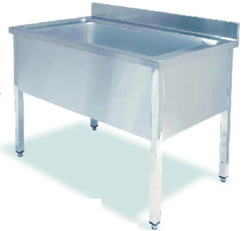
FI7GC 1400 1 + BAST GC 147