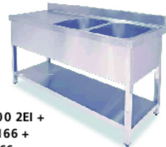
FIG 1600 2EI + BAST 166 + ESTB-166