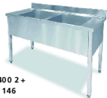
FIG 1400 2 + BAST 146